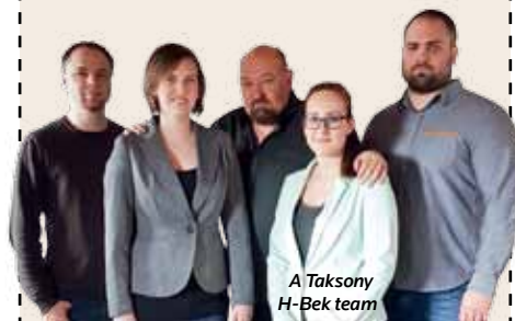
A Taksony H-Bek team